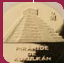
Pirámide de Kukulcán