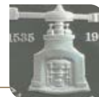
Prensa de Volante

Emblema del México actual, este monolito prehispánico es inspiración para toda la moneda circulante del país...