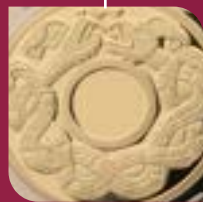
Aro de Juego de Pelota