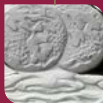
Dos continentes y mares