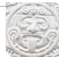
Tonatiuh, Piedra de los Soles