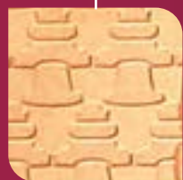
Campana de Dolores