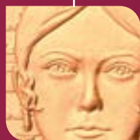
Efigie de una mujer independentista