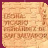
Nombre de soltera